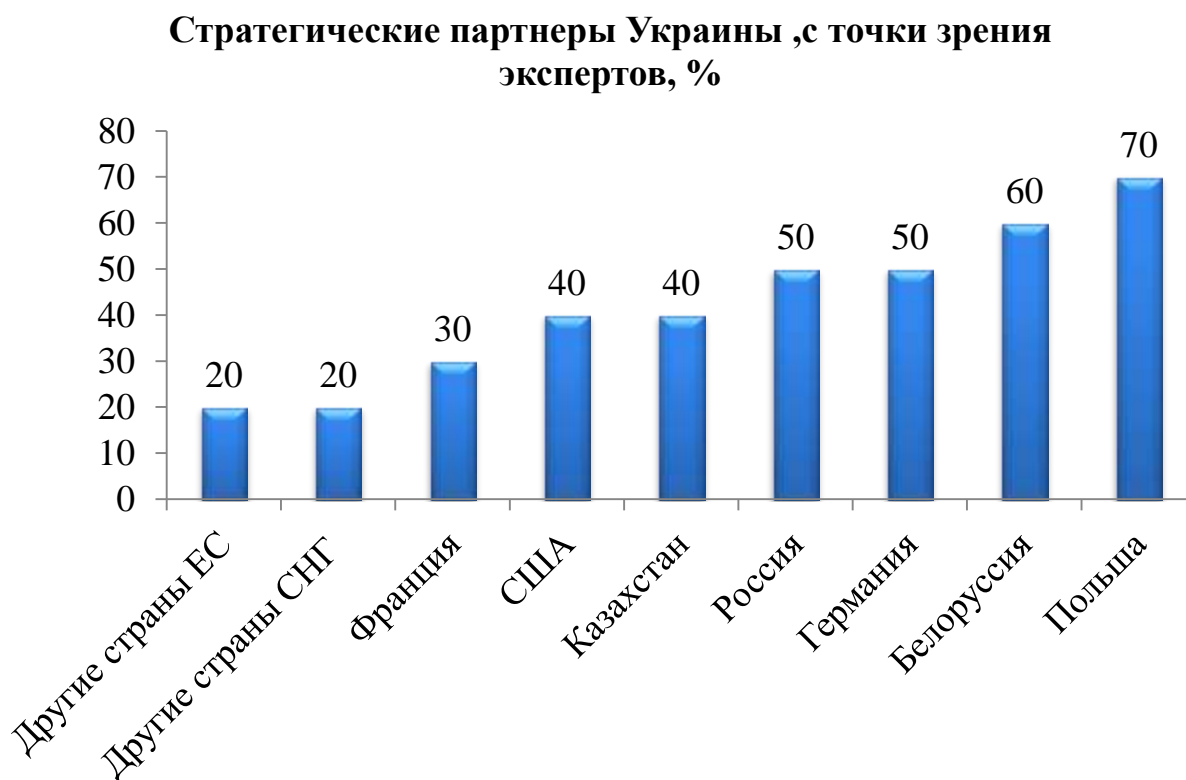
Диаграмма №1. 1

Таким образом, по-мнению экспертов, можно выделить 4 основных партнера для Украины: